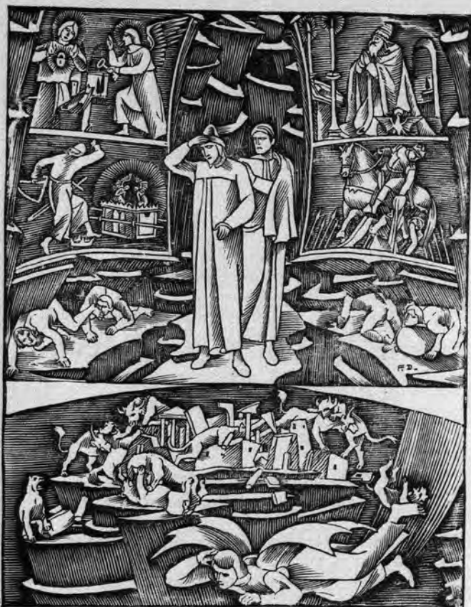
D. Fáy: Ilustraĵo al la komedio de Dante

rilate al la loĝantaro de la tuta ŝtato. La iama aŭstria regiono (Galicio kaj Cieszyn'a Silezio) posedinta preskaŭ plenan kulturaŭtonomion, estas reprezentata de 41.4% de la literaturistaro ĉe 26.6% de la loĝantaro. Dume, el la iama germania regiono Poznanio, Pomeranio, Supera Silezio, travivinta teruran premon kulturalan, kiu celis la ekstermon de la pola nacieco ne ekzistis ĉe unu pola lernejo, la instruado de la pola lingvo estis severe punata kaj ĉe parolado en tiu lingvo en publikaj kunvenoj en iuj urboj malpermesata, devenas nur 3.9% de la literaturistaro (14.1% de la loĝantaro). Krome, la preskaŭa socia homogeneco (agrikultura karaktero) de Pomeranio kaj Poznanio kaŭzas ankaŭ ties relativan pasivecon ideologiajn kaj kulturalan.